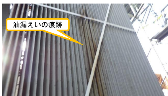
(写真 1 - 2) 3号機起動用変圧器 (A) の油漏えい 痕跡の状況