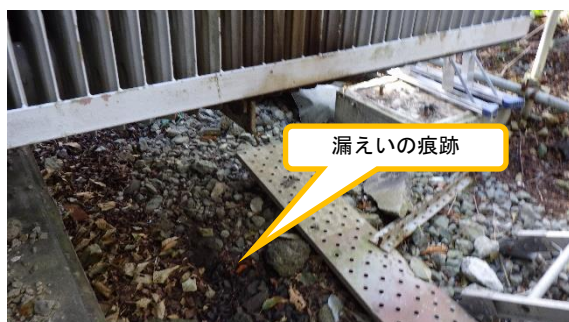
(写真 1 - 3) 3号機起動用変圧器 (A) 下部の油 漏えい痕跡の状況