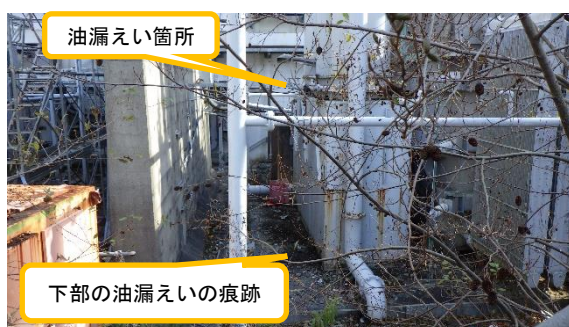
(写真 1 - 4) 3号機起動用変圧器 (B) の油漏えい 痕跡の状況