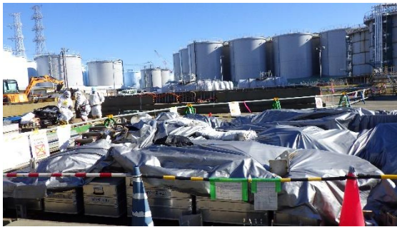
(写真2) H9タンクエリア南側の状況 (南西側から撮影)