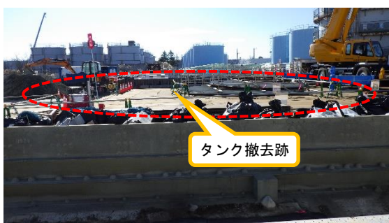
(写真1-1) H9タンクエリアの状況 (北側から撮影)