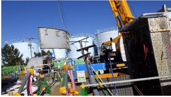
(写真1-3) H9西タンクエリアB 1タンクの解体作業の状況② (南側から撮影)