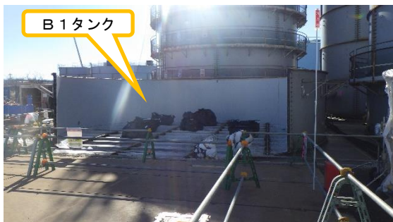
(写真1-2) H9西タンクエリアB1タンクの解体作業の状況① (北側から撮影)