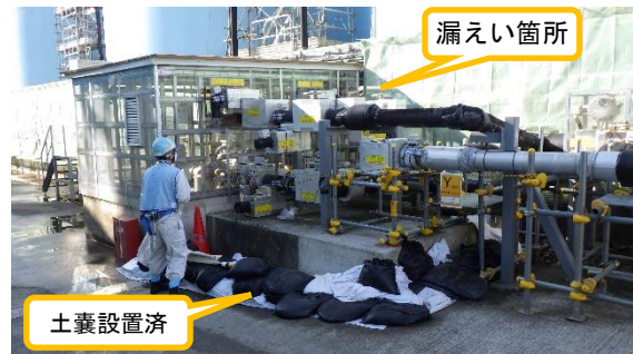
(写真 2 - 2) 同左 今回撮影