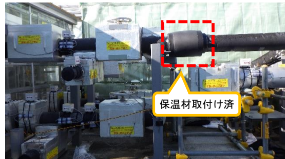
(写真 1 - 2) 同左 今回撮影