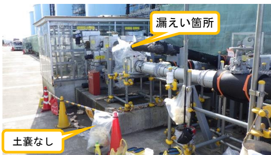
(写真 2 - 1) 漏えい箇所周辺の状況 前回 (12月17日) 撮影