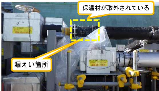
(写真 1 - 1) 漏えい箇所の状況 前回 (12月17日) 撮影