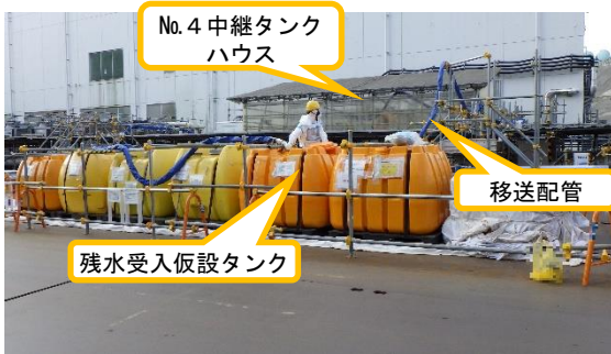
(写真1-2) 仮設タンク側の作業状況 (東側から撮影)