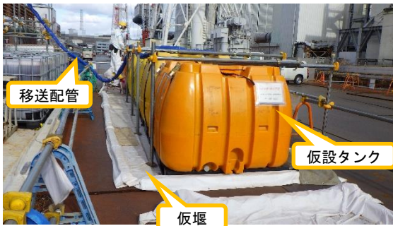
(写真2) 仮設タンクの設置状況等 (南側から撮影)