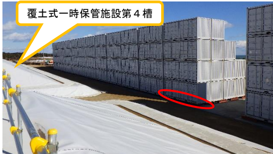
(写真 3 - 1) AAエリア北側の状況 (南西側から撮影)