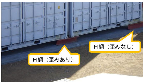
(写真 3 - 2) 写真 3 - 1 赤丸部分拡大