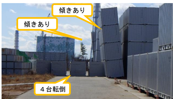
(写真1-4) AAエリア南側(海側)の状況 (北側から撮影)