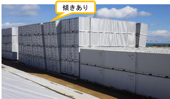
(写真1-3) 傾き箇所拡大 (南西側から撮影)