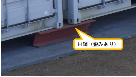
(写真3-3) H鋼 (歪みあり) 拡大