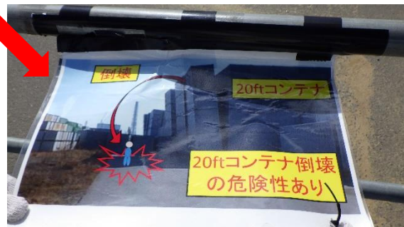
(写真 2 - 3) コンテナ倒壊の危険性の掲示