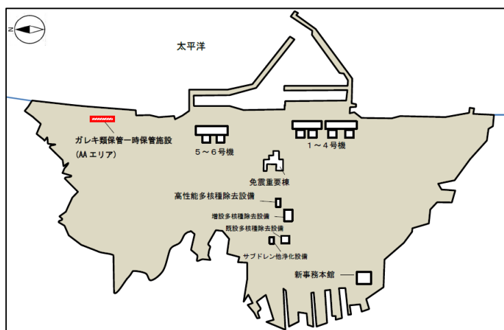
(図1) 福島第一原子力発電所構内概略図