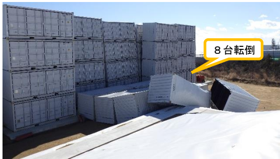
(写真1-2) 転倒箇所拡大 (北西側から撮影)