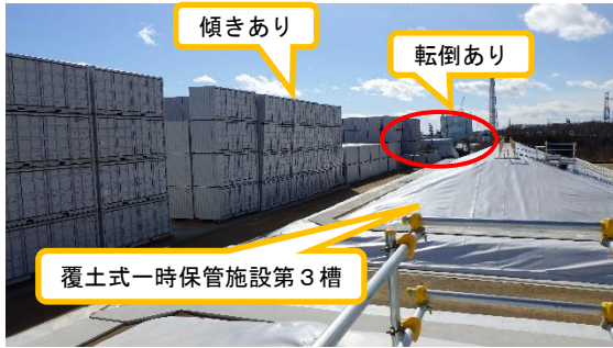
(写真1-1) AAエリア南側(陸側)の状況 (北西側から撮影)