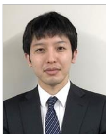
商工労働部 産業創出課

福島県では、再生可能エネルギーの推進を復興の柱の一つに掲げており、再生可能エネルギーの導入拡大や、関連産業の育成・集積を進めています。その一環として、再生可能エネルギー関連産業でビジネスに取り組む企業・団体の皆様に技術・情報の発信や商談・交流の場を提供するため、ふくしま再生可能エネルギー産業フェア（REIFふくしま）を開催しています。REIFふくしまでは、再生可能エネルギーに関する多くの企業・団体が出展し、最新技術の展示やセミナーなどの各種イベントを実施しています。