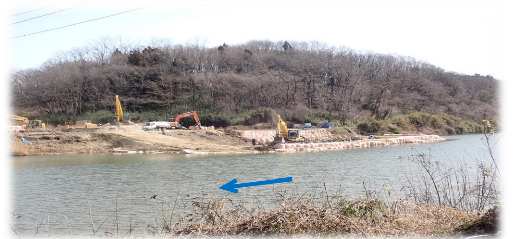
左岸から右岸を望む