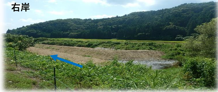
上流(左岸)から下流を望む