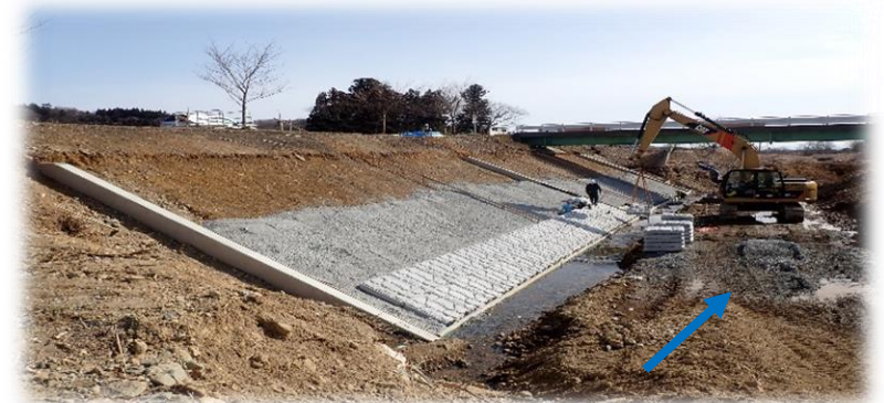
上流から下流を望む