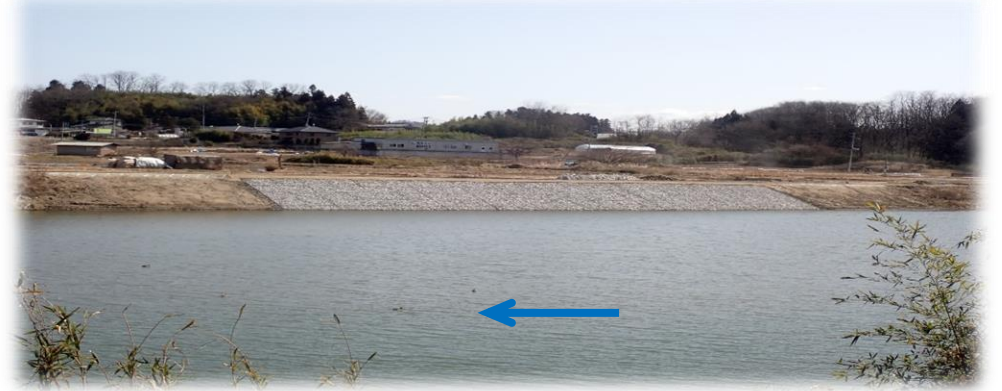
左岸から右岸を望む