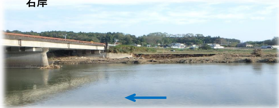
左岸から右岸を望む