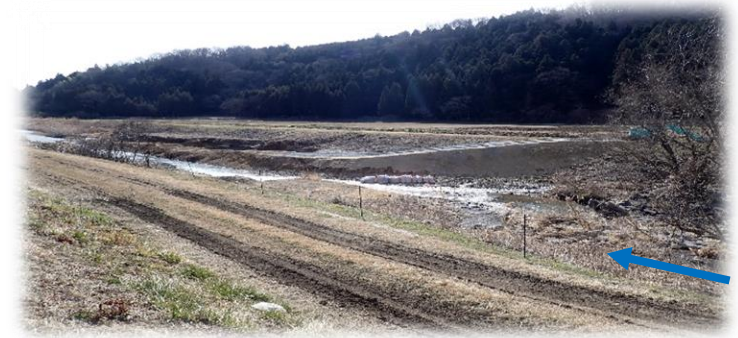
上流(左岸)から下流を望む