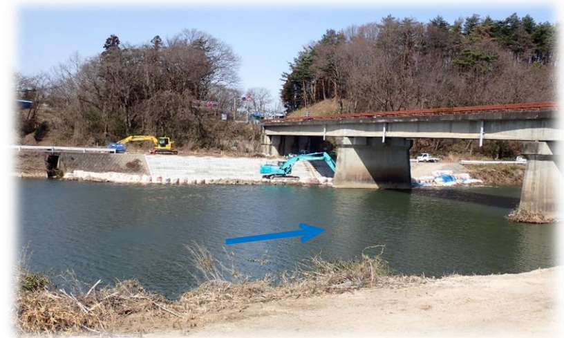
右岸から左岸を望む