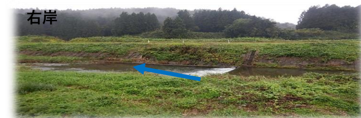
上流(左岸)から下流を望む