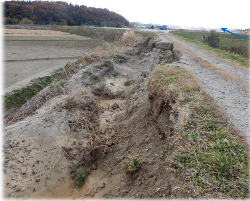
上流から下流を望む