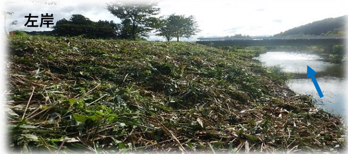
上流から下流を望む