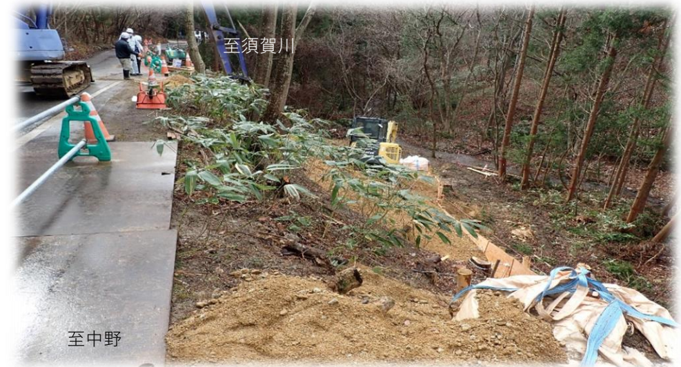
中野方面から須賀川方面を望む