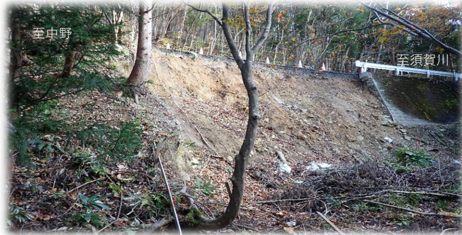
中野方面から須賀川方面を望む