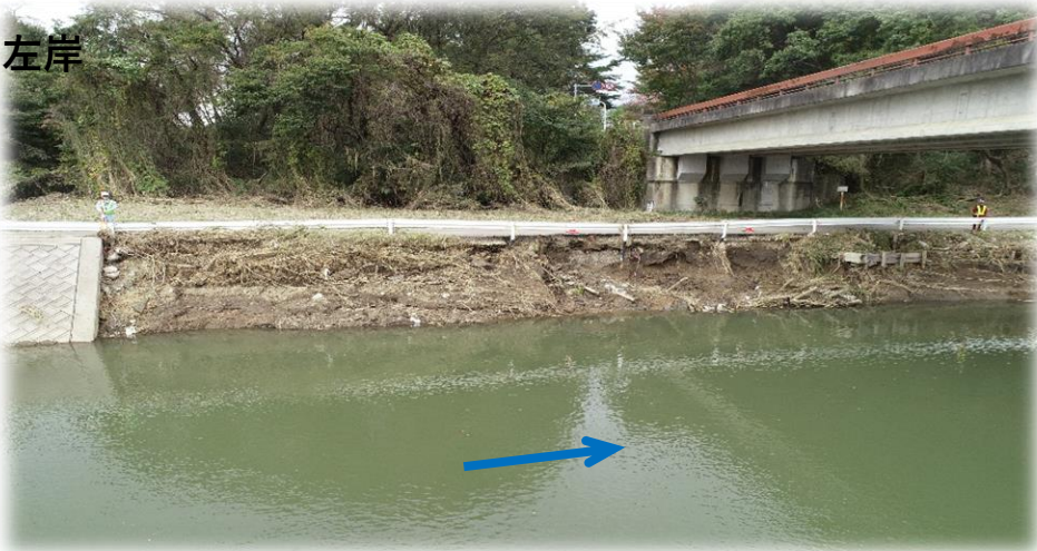
右岸から左岸を望む