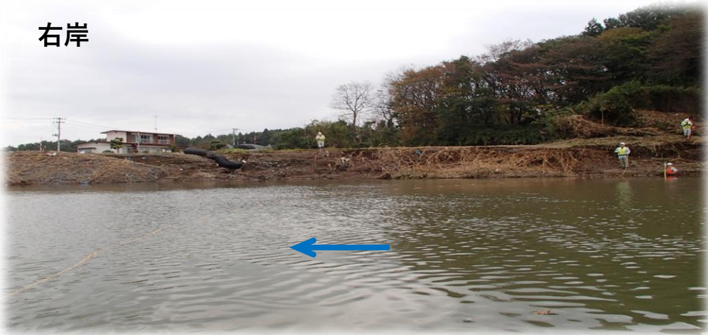
左岸から右岸を望む