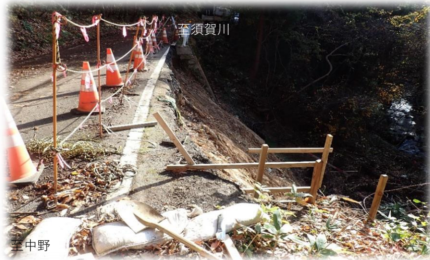
中野方面から須賀川方面を望む