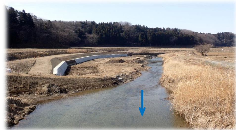
里橋から上流側 下流から上流を望む