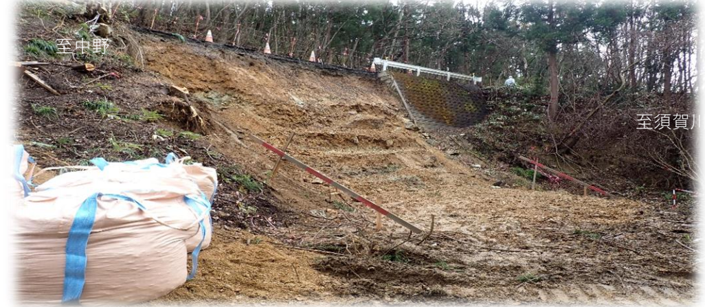
中野方面から須賀川方面を望む