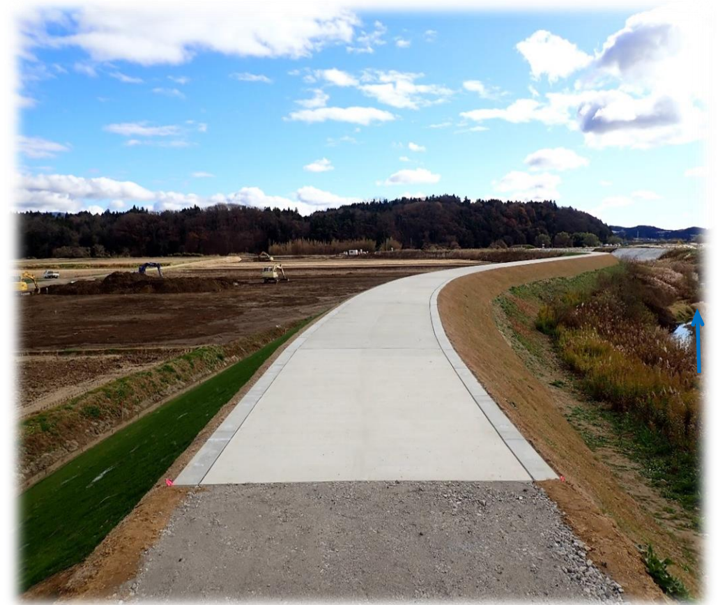
下流から上流を望む