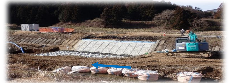
上流(左岸)から下流を望む