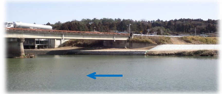
左岸から右岸を望む 状況