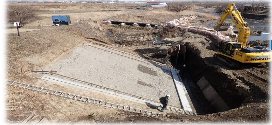
里橋から下流側 右岸から左岸を望む