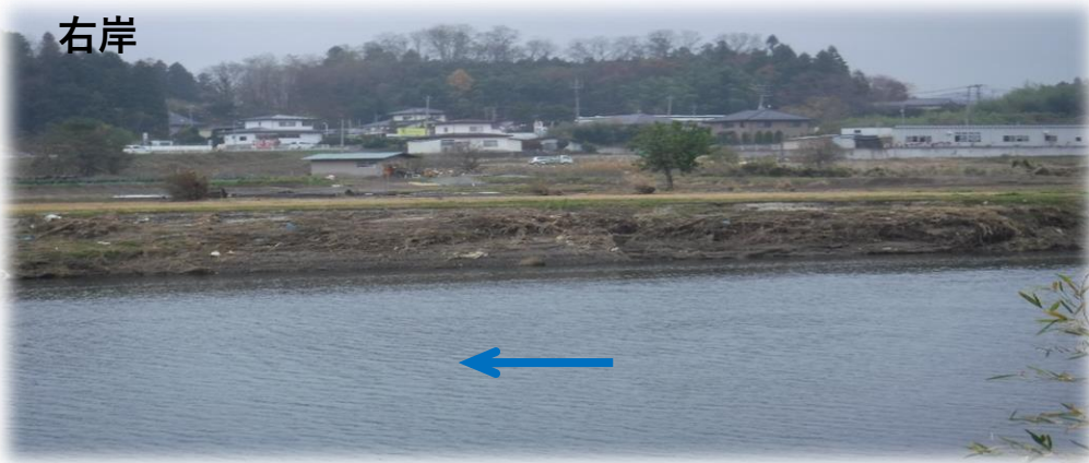
左岸から右岸を望む