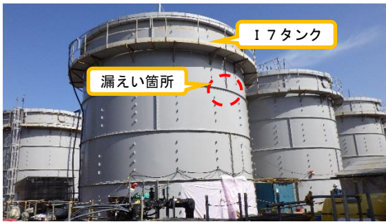
(写真1-1) F1タンクエリア外観 (南西側から撮影)