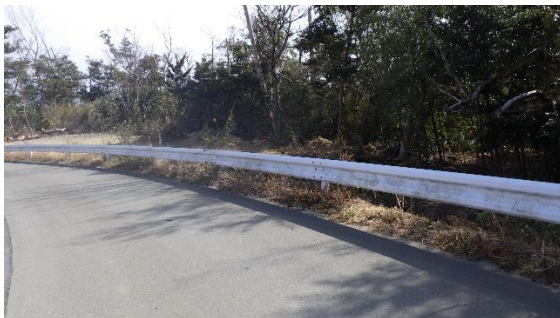
(写真2-3) 今回の状況 (令和3年3月1日撮影)