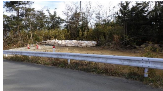
(写真2-2) 前回の状況 (令和2年12月24日撮影)