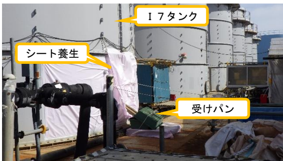
(写真1-2) I7タンク漏えい箇所下部の状況 (南西側から撮影)