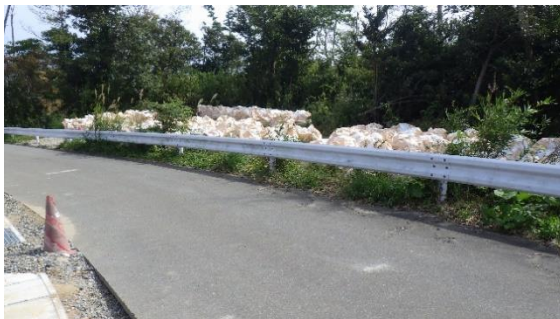
(写真2-1) 前々回の状況 (令和2年9月29日撮影)