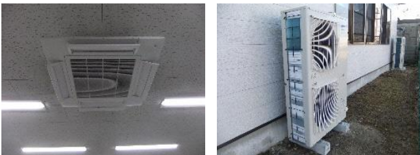
★省エネエアコンへの更新