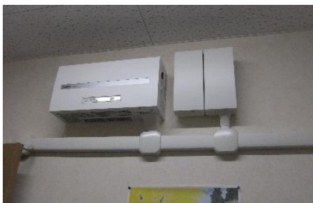
★太陽光発電設備の導入