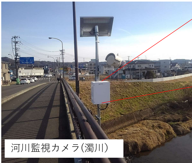
河川監視カメラ(濁川)

住民の皆様が災害時に適切な行動が取れるように 川の水位や映像などの情報提供を行っています