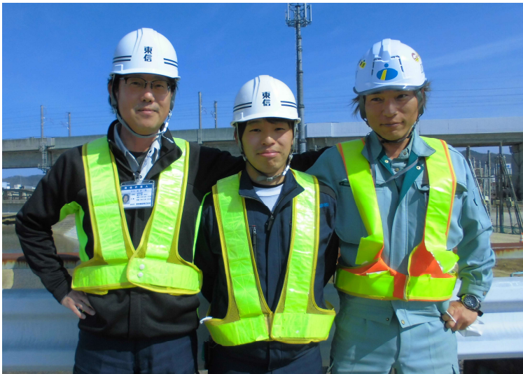
(株)東信建設の皆さん

管内では多くの災害復旧工事が実施されておりますが、 今回は大森川の工事現場の担当の方にお話を伺いました！