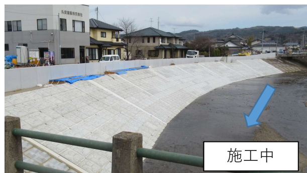
塩野川(伊達市梁川地区)