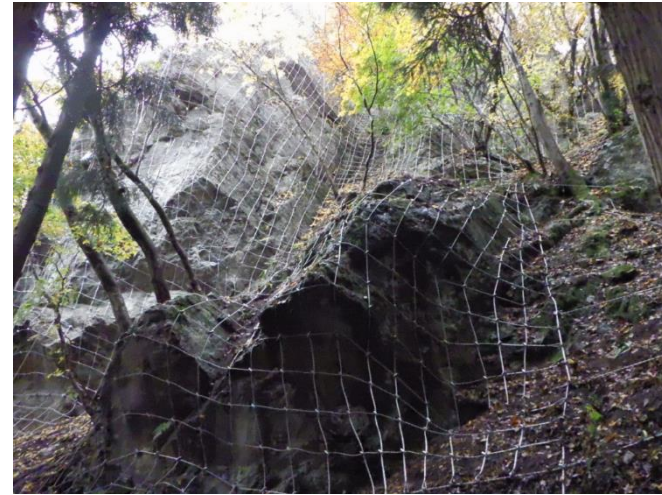
下郷町小沼崎地内

令和2年度は、ロープネット工等の整備を進めました。令和3年度は引き続き工事を進め、工区完了を目指します。