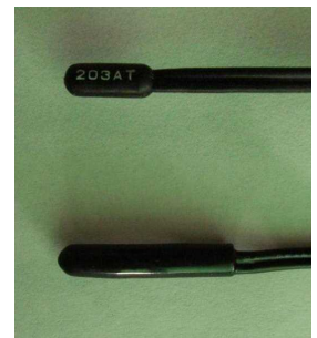
図1 樹脂製の汎用センサー