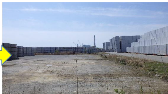
(写真2-2) 同左 今回の状況 (4月8日撮影)

5 プラント関連パラメータ等確認 本日確認したデータについて、異常な値は確認されなかった。