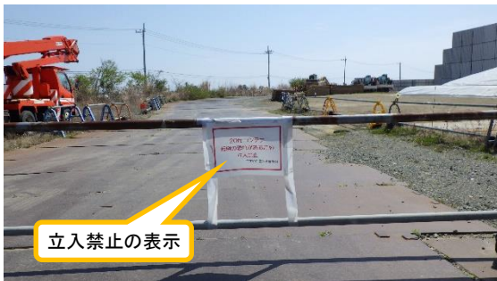
(写真1-3) 入口の立入禁止措置の状況 (「転倒の恐れがあるため立入禁止」の表示)