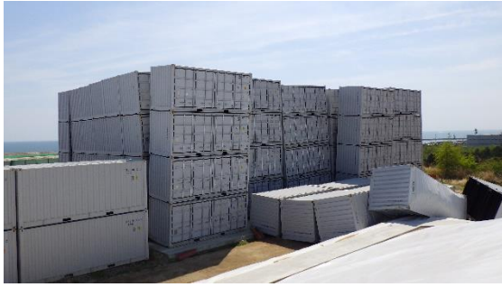
(写真1-1) コンテナの転倒及び傾きの状況 ① (西側)