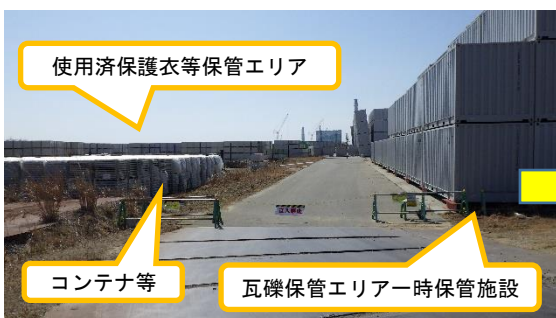
(写真2-1) 使用済保護衣等保管エリア 前回の状況 (3月11日撮影)