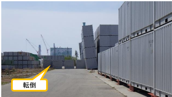
(写真1-2) コンテナの転倒及び傾きの状況 ② (東側)