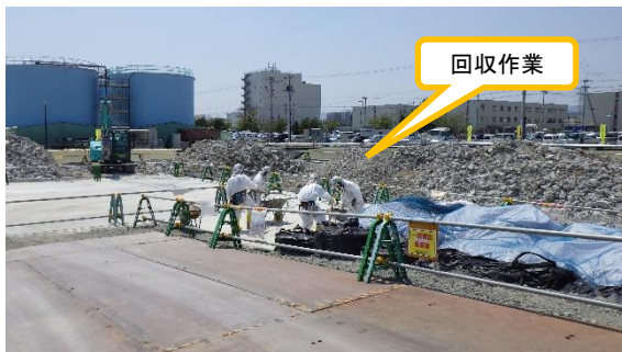
(写真 3) 鉄筋等回収作業の状況

5 プラント関連パラメータ等確認 本日確認したデータについて、異常な値は確認されなかった。