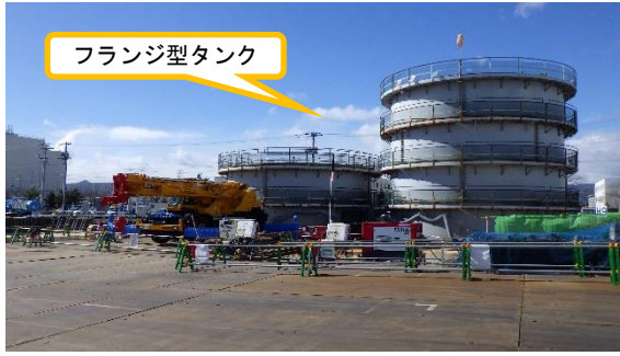
(写真 1 - 1) 前回の状況 (令和 3 年 1 月 29 日撮影)