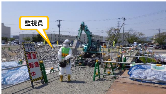
(写真 2 - 2) コンクリートの小割作業の状況