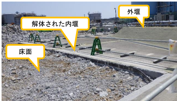
(写真 2 - 1) 堰内の状況