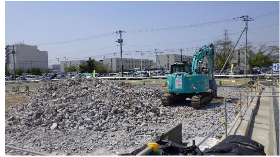
(写真 1 - 2) 今回の状況 (令和 3 年 4 月 20 日撮影)