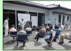
地元説明会の様子