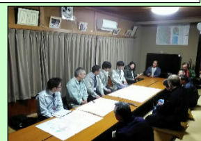
営農計画打合せ状況