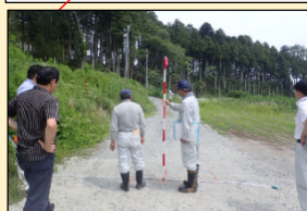
地元との現場確認状況