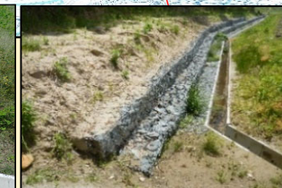
ふとんかご施工後