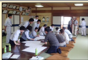
地区境界確認状況