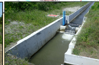
支線排水路施工状況