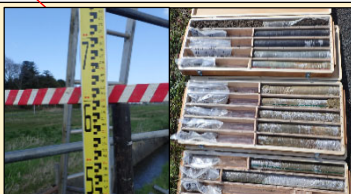
ボーリング調査状況