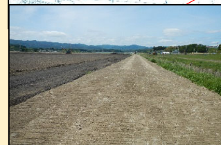
農道 (ずり使用) 施工状況