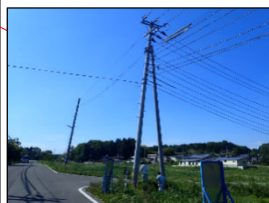
支障物件確認状況