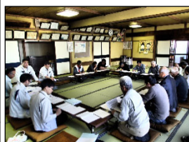
道水路の配置や区割等検討状況