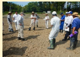
現地説明会の様子