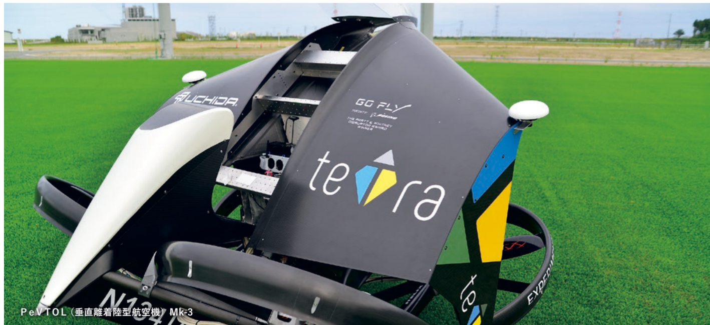
PeVTOL (垂直離着陸型航空機) Mk-3

注目のプロジェクト 航空宇宙分野 ○実施期間 2020年度 ○実用化開発場所 南相馬市・埼玉県戸田市 (採択事例紹介 P105)