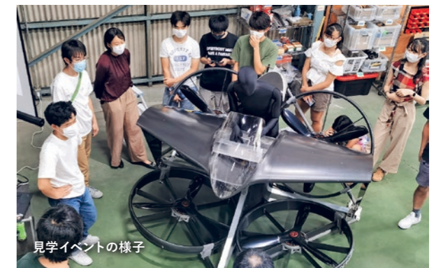
見学イベントの様子