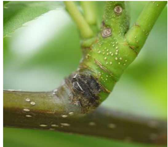
図2 果そう基部病斑 (令和3年5月25日撮影)