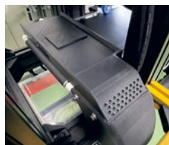
エアブロー・トラッキング