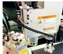
ロボット・トラッキング