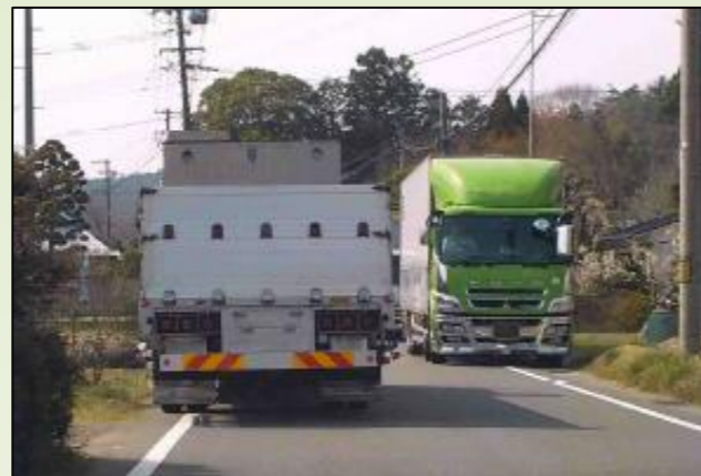
道幅が狭く大型車のすれ違いが困難