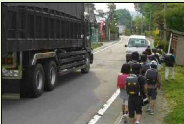
道幅が狭く歩行空間が不十分

このため、平成30年代前半の供用開始を目指し、歩道を設けて十分な道幅を確保した新しい道路の設備を進めています。