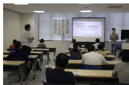
猫の飼い方講習会(会津若松会場)