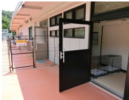
猫舎に設置した扉 (経過観察室への出入口)