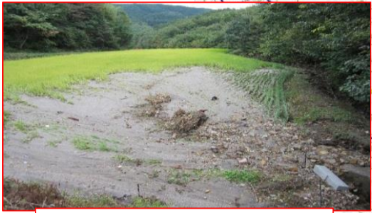
水田への土砂流入(葛尾村)