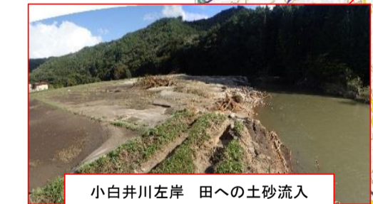
小白井川左岸 田への土砂流入(川内村)