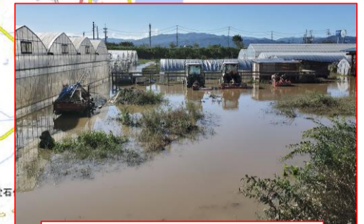
パイプハウス 冠水(浪江町)