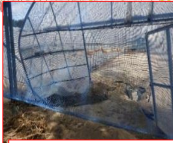
育苗ハウス倒壊(川内村)