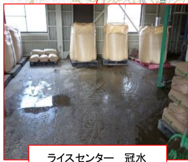
ライスセンター 冠水(川内村)