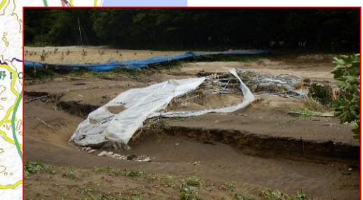
パイプハウス倒壊・土砂流入(楢葉町)