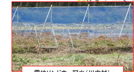
露地リンドウ 冠水(川内村)