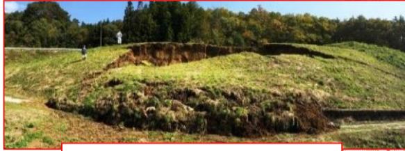
農地法面崩落(葛尾村)