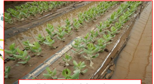
花き 冠水・土砂流入(浪江町)