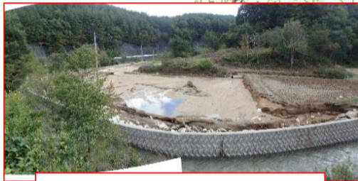
木戸川右岸 田の表土流出・土砂流入(川内村)