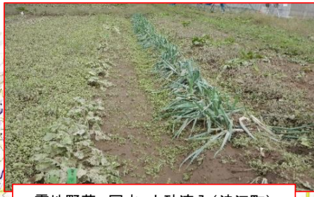
露地野菜 冠水・土砂流入(浪江町)