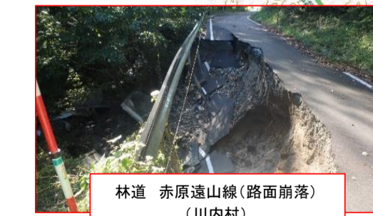
林道 赤原遠山線(路面崩落)(川内村)