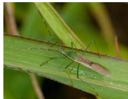
図 クモヘリカメムシの成虫