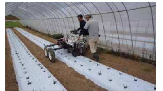
写真 機械移植作業の様子