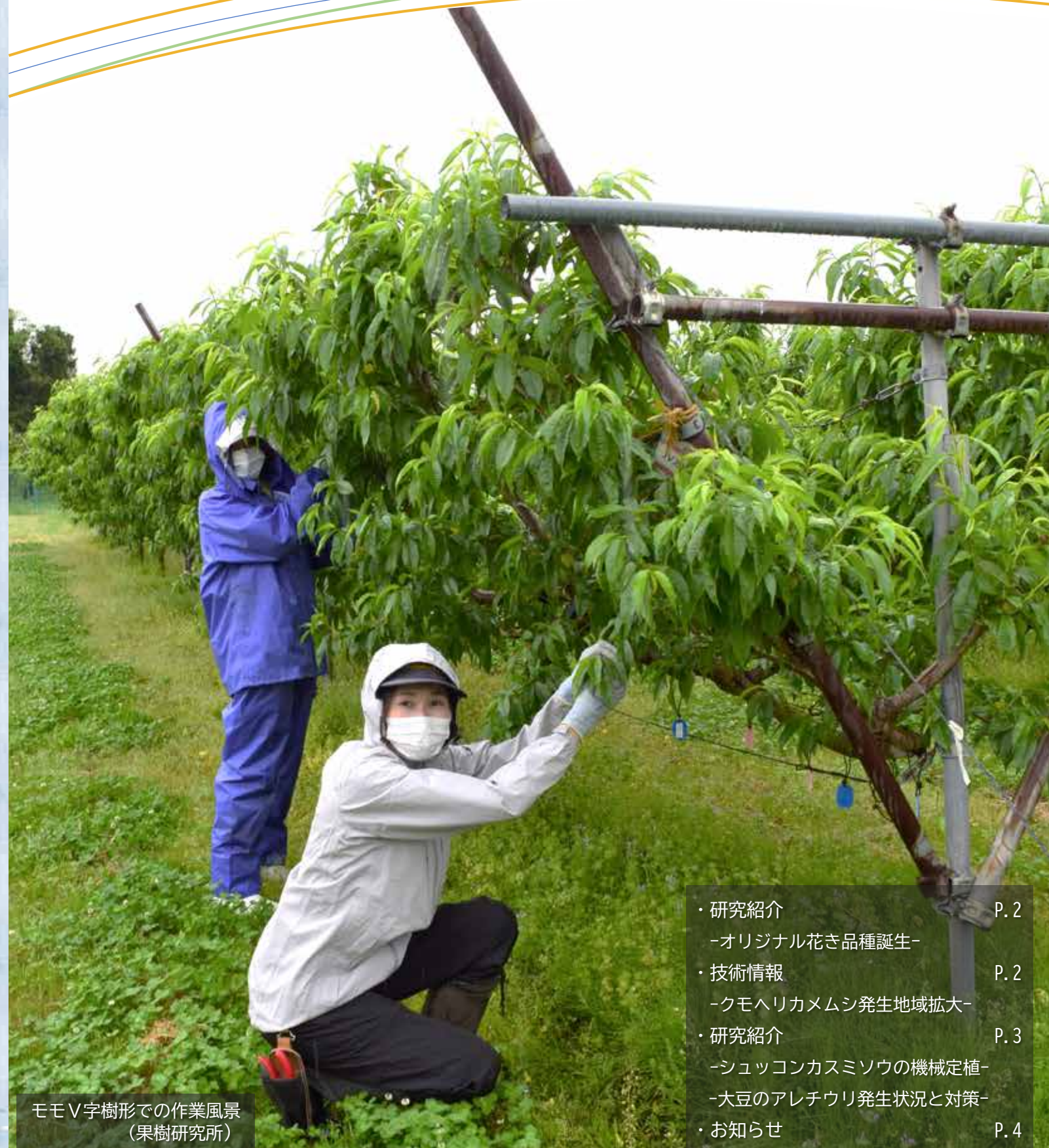
モモV字樹形での作業風景