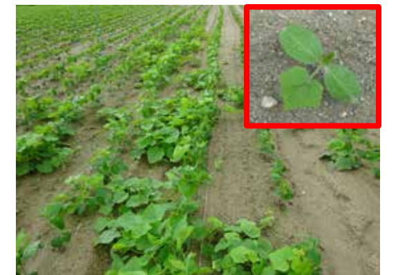
図1 アレチウリ発生ほ場とアレチウリの生育初期(赤枠)

翌年以降の発生を減らすためには土中の休眠種子を減らすことが重要です。枯れ残った個体は下部から新しいつるを伸ばしますので、以下の防除体系に加え、アレチウリが開花する8~9月までに手取り除草を行ってください。法面からも侵入しますので、ほ場周辺の防除も必要になります。