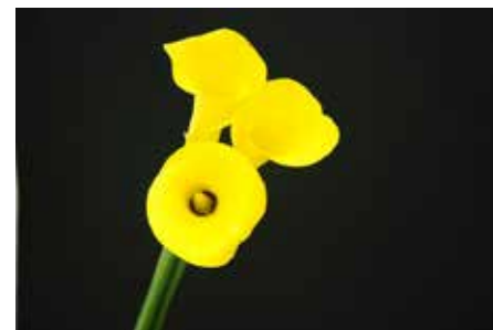
「キビタンイエロー」