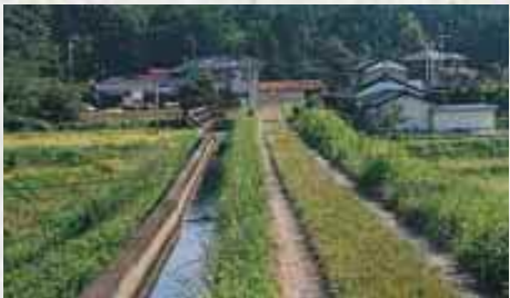
高慶は、この七千石用水(左・鹿島町)をはじめ、領内の用水路や堤の整備に力を注ぎました。これらは現在も農業用水に使われ、相双地方の人々は今もなお、御仕法の恩恵に浴しています