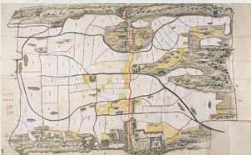
御仕法発案の地、相馬領坪田村絵図(相馬和胤氏所蔵) 弘化二年(1844)、相馬領内の二宮仕法はこの坪田村と成田村の二村から始まりました。御仕法を始めるにあたって、高慶の人徳とその前向きの気概と誠意を見た国家老・池田胤直は、「富田は自国興復のために天から降るされた人ようだ」と語りました

御仕法が始まって間もない初冬の早朝、農民が起きて家の前の道に出てみると、そこにはすでに高慶が開墾の様子を見回り、雪を踏みしめた足跡が。決して何かを押しつけることなく、率先垂範を物語る。そんな美しい光景に打たれ、農民たちは日々仕事に励んでいたのだ。 このようにして、明治四年(1871)に二宮仕法が廃止されるまでの二十七年間に、高慶は、領内三郡二十六村のうち、一〇一村で御仕法を行い、五十五村を完了させました。これは、二宮仕法を行った全国諸藩の中でも屈指の成功でした。そして高慶は、御仕法の目に見える