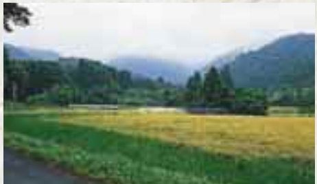
相馬藩領 二宮仕法 施行の地