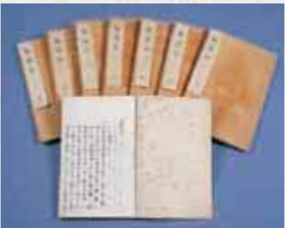
報徳記(相馬和胤氏所蔵) 安政三年(1856)に書かれた富田高慶の著書。師・二宮尊徳の教えを知る記録のないことを懸念して残されたこの書は、極めて優れた貴重なもので、のちに藩主・相馬充胤から明治天皇に献上され、勅命によって宮内省から刊行されています(他の著書に「報徳論」など)