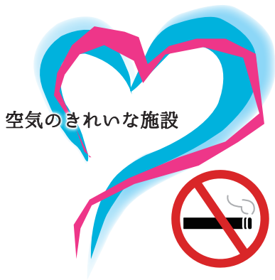
空気のきれいな施設