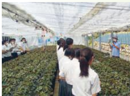
相馬農高生による 鉢花経営の視察