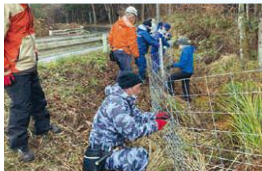
【ワイヤーメッシュ柵の設置】