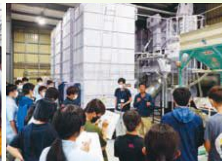
県農短生による ライスセンターの視察②