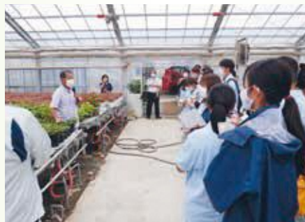
県農短生による 鉢花経営の視察視察①