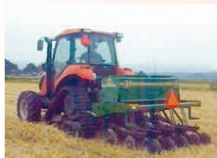
麦跡大豆不耕起播種

株式会社高ライスセンターは、南相馬市原町区の農地集積にあたって、基盤整備を機に設立された各地区の農用地利用改善団体が農地の利用調整を行ったことで、経営面積の拡大と作物のブロックローテーションを効率的に実現しています。