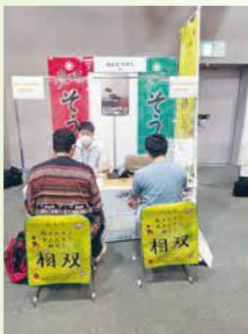
就農相談会の様子

県農業短期大学校の学生50名と相馬農業高校の生徒30名を対象に、相双地方の農業法人の視察会を実施しました。当日は、農業法人経営や相双地方の復興に取り組む姿をみていただき、職業の選択肢の中に、農業法人での雇用による就農もあることを学んでいただきました。