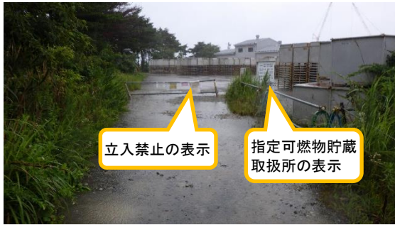
(写真1) 一時保管エリア e の入り口の状況