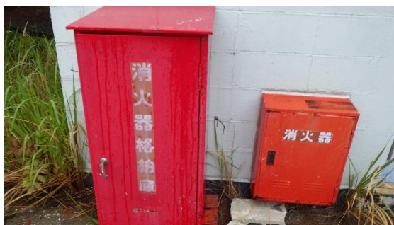
(写真3-2) 一時保管エリア e 内に設置された消火器の例②

5 プラント関連パラメータ等確認 本日確認したデータについて、異常な値は確認されなかった。