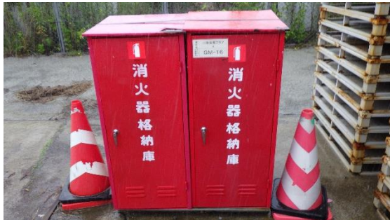
(写真3-1) 一時保管エリア e 内に設置された消火器の例①