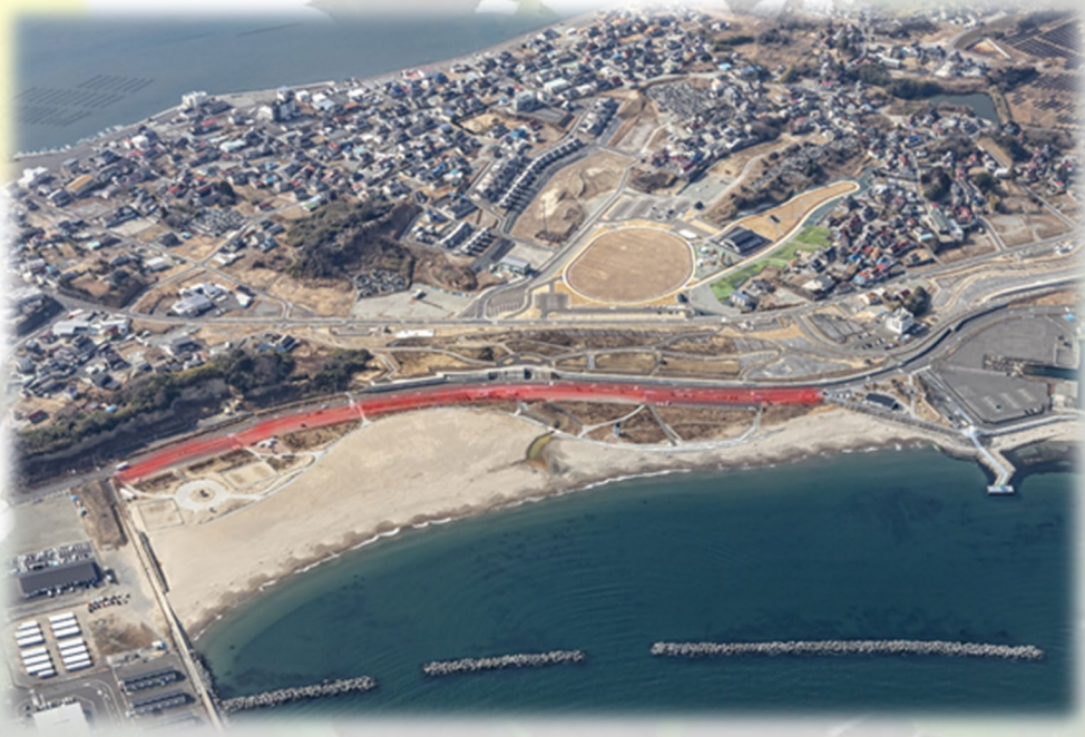
(写真1) オーナー花壇の場所…原釜海水浴場周辺の花壇（道路の海岸側・赤く塗った部分）です。