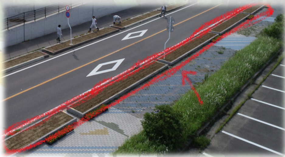
(写真2) 植栽していただく花壇。一つの花壇は、下図のとおり4区画に分かれます。