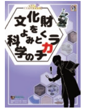
文化財をよみとく 科学のチカラ

文化財を読み解くには、科学のチカラが欠かせません。目には見えない文化財の構造や材質、失われた当時の環境など、わずかな痕跡から見えてくる歴史があります。さまざまな情報を文化財から読み解く科学のチカラを、これまでの調査成果と共にご紹介します。