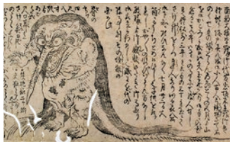
奥州会津怪獣の絵図(個人蔵)

東北の入口、福島県。そこはこの世界と別の世界の入り交じる「あはひ(=間)のクニ」、そして妖怪や幽霊をはじめとする怪異が息づく「あやかしのクニ」でした。私たちの隣でうごめき、さまざまな境界を越える不思議なモノたち。それらを通じて、ふくしまという奇妙で魅力的な不思議のクニをご案内します。