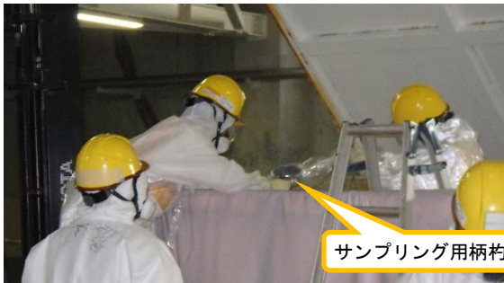
(写真2) コンテナ内の溜水採水の状況