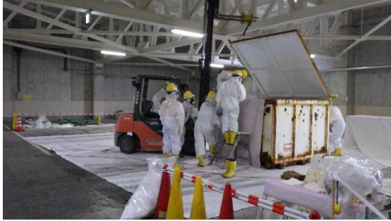
(写真1) コンテナの内容物確認作業の状況