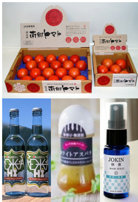
写真はいずれもイメージです。