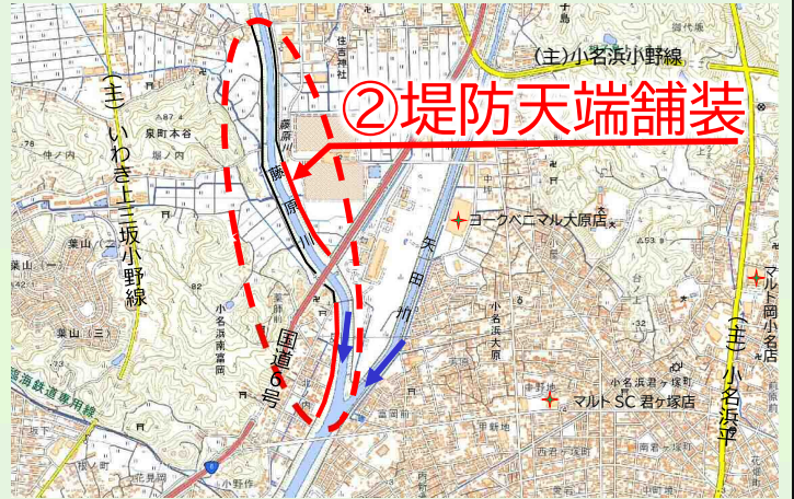
写真 現在、災害復旧工事等を実施している代表的な箇所を掲載しています。