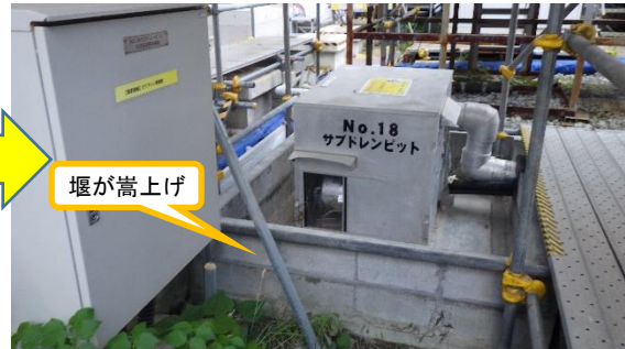
(写真 3 - 2) 今回の状況 (令和 3年 8月 5日 撮影)