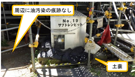
(写真1-2) サブドレンピットNo. 19の状況