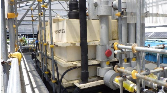
(写真 2 - 1) No. 3中継タンクの外観