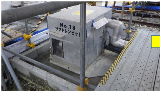
(写真 3 - 1) 前回の状況 (令和 2年 8月 4日 撮影)