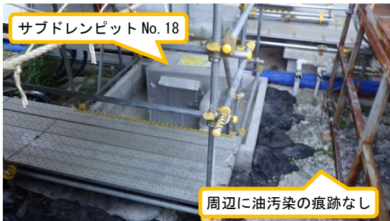
(写真1-1) サブドレンピットNo. 18の状況