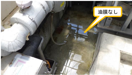
(写真 2 - 2) No. 3中継タンクの堰内の状況