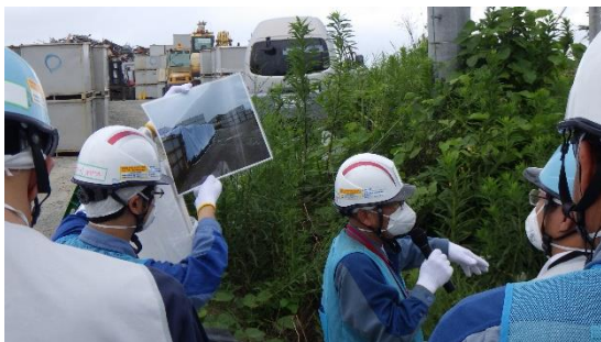
（写真1-2）漏えいが発生したノッチタンクの対策状況（ノッチタンクのシート養生、ノッチタンク周辺土壌の撤去）について聞き取りを行う様子