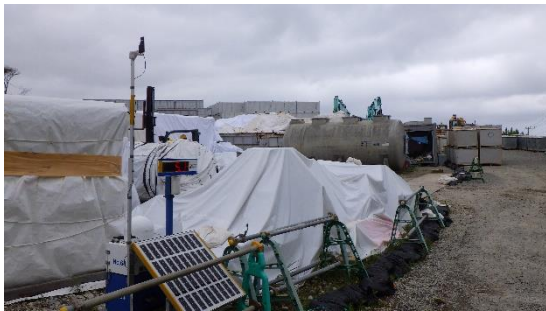
（写真1-1）ガレキ一時保管エリアP入口付近（図1の①）