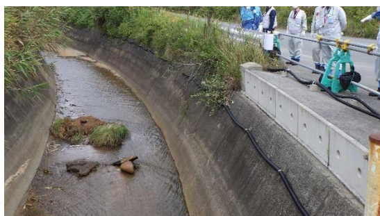
(写真1-7) 陳場沢川流域の状況 (図1③)