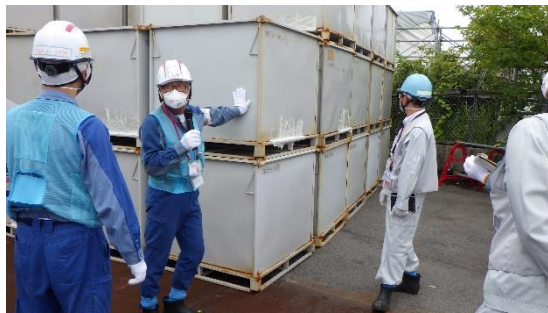
(写真3-2) 一時保管エリア W1 にて外観目視点検後に補修が実施されたコンテナの状況