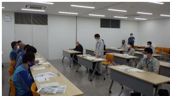
(写真4) 質疑応答の様子