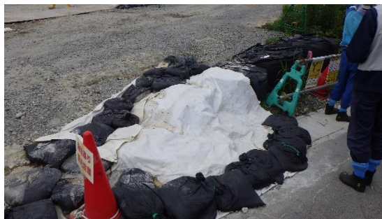
(写真1-4) ノッチタンクからの漏えい水が流れ込んだエリア P の南側排水溝には、対策として放射性物質を吸着するゼオライト土嚢が設置されていた。