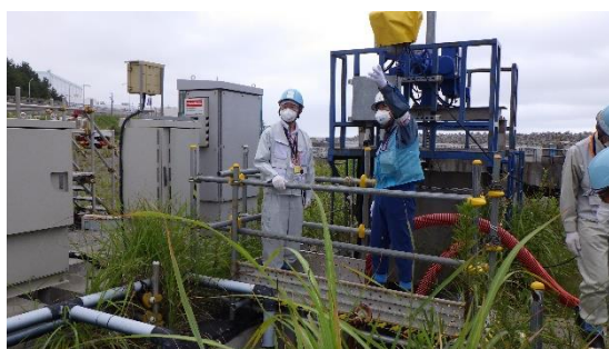
(写真2-1) 物揚場排水路ゲート

放射線モニタの値が基準値より高値を示した場合は、このゲートを閉めて排水の流出を防ぐ。