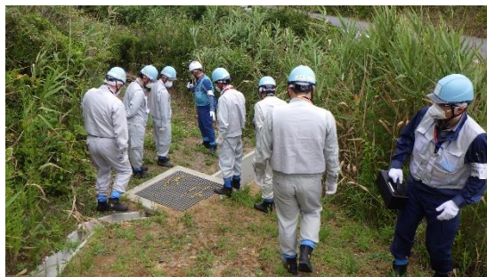
(写真1-5) 南側排水溝排水口付近の状況について (図1②付近)