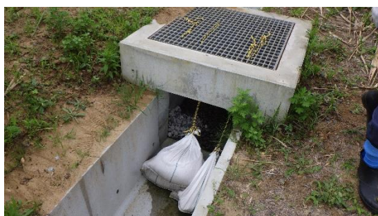
(写真1-6) 一時保管エリア P の南側排水路の陳場沢川合流前に設置されたゼオライト土嚢