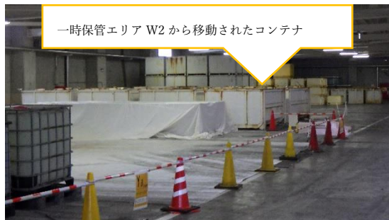
(写真3-1) 固体廃棄物貯蔵庫第2棟内に保管されているガレキ一時保管エリア W2 から移動されたコンテナ