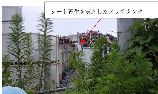
(写真1-3) シート養生を実施したノッチタンク