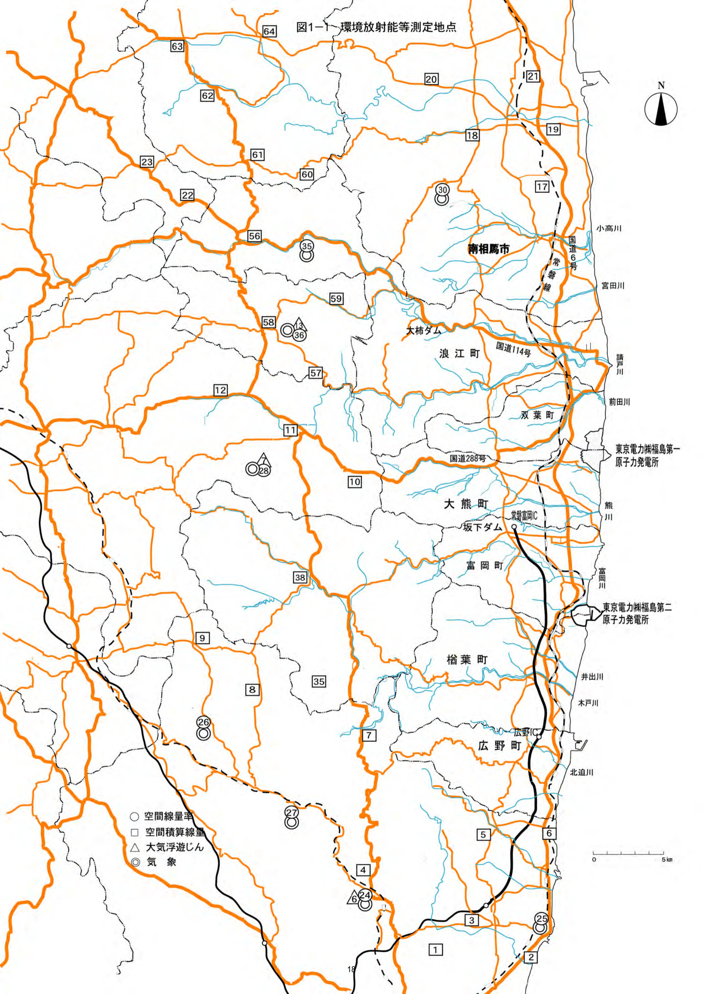
図1-1 環境放射能等測定地点