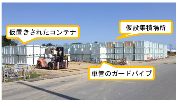
(写真1-1) 土捨て場南造成エリア南側ヤードの 仮設集積場所の外観 (南西側から撮影)