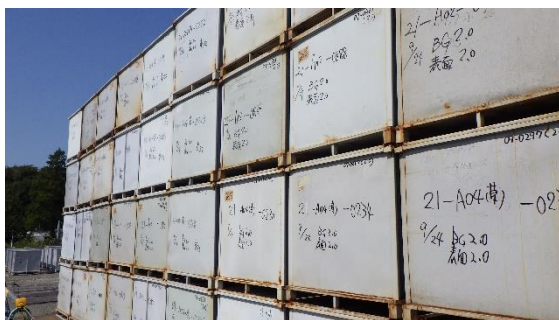
(写真2-3) 廃棄物が収納されたコンテナの側面の状況 (南側から撮影)