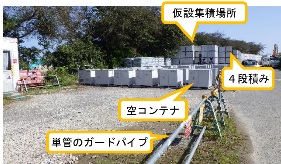
(写真2-1) ジャバラハウス近傍エリアの仮設集積場所の外観 (西側から撮影)