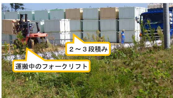
(写真1-3) 仮設集積場所への搬入の状況 (南西側から撮影)