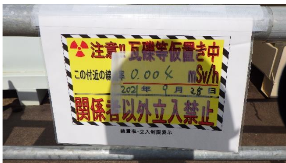
(写真1-2) 関係者以外立入禁止の表記 (南側から撮影)