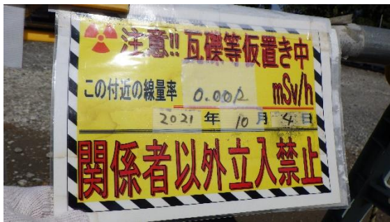
(写真2-2) 関係者以外立入禁止の表記 (南側から撮影)