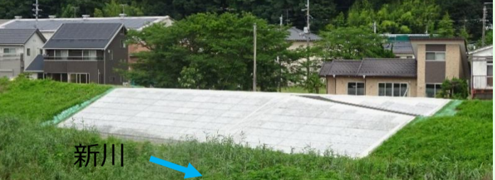
御厩工区 (令和3年6月完了) 堤防補強工 堤防舗装 防草シート