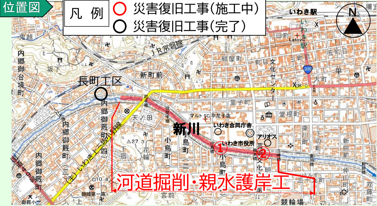
長町工区 (令和2年6月末完了) 内郷御厩町字長町地内 護岸工 L=37.5m