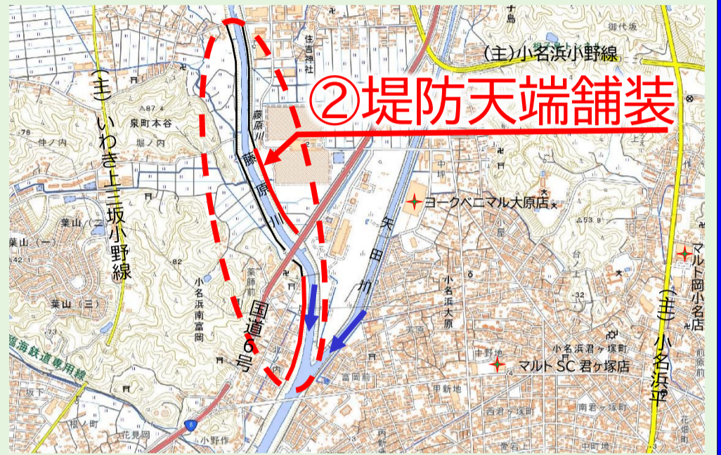
写真 現在、災害復旧工事等を実施している代表的な箇所を掲載しています。