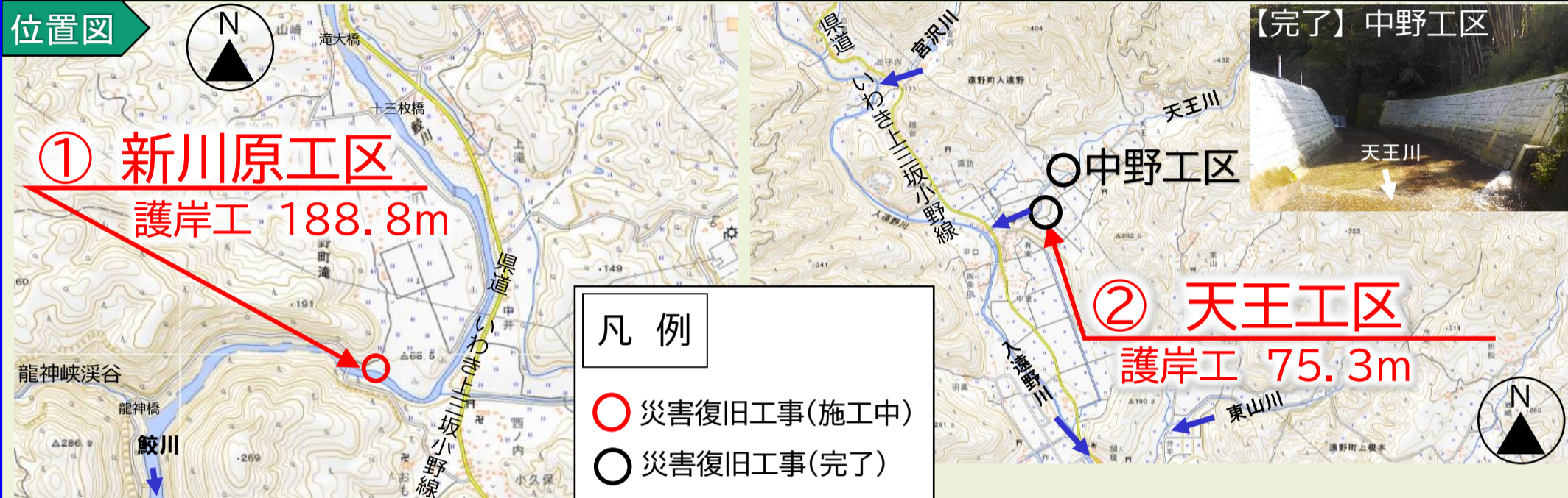
写真 現在、災害復旧工事を実施している代表的な箇所を掲載しています。