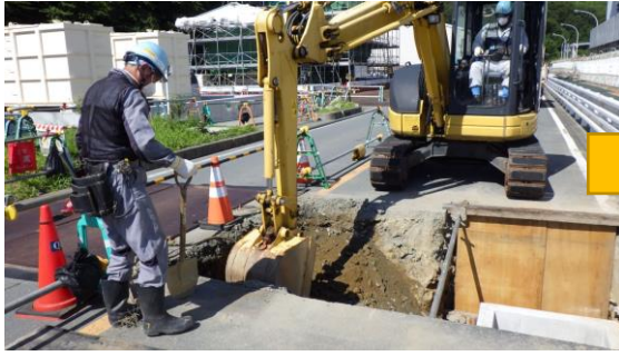
(写真4-1) 移送配管埋設工事の状況 (前回 (8月4日) 撮影)