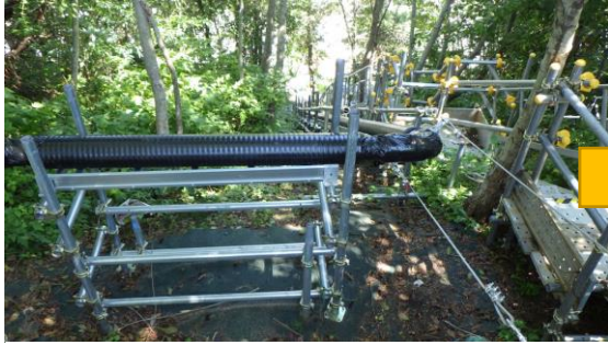
(写真1-1) 配管敷設状況 (前回 (8月4日) 撮影、5・6号機南側法面を南側から撮影)