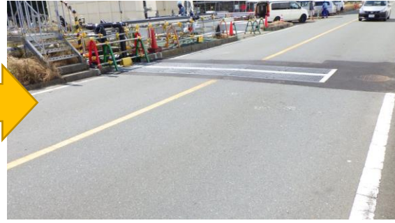
(写真4-2) 配管埋設の状況 (今回 (10月8日) 撮影)