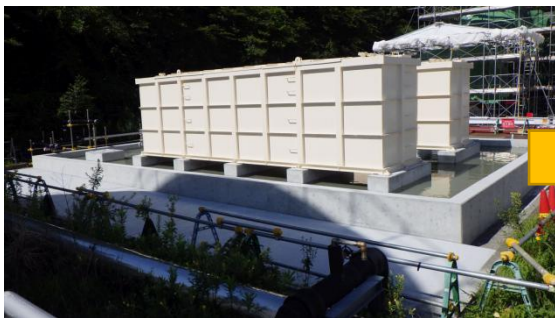
(写真3-1) 中継タンク設置状況 (前回 (8月4日) 撮影)