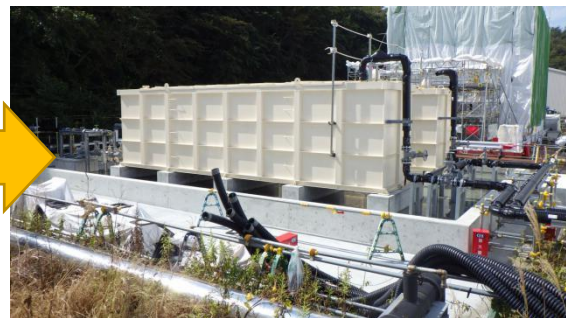
(写真3-2) 中継タンクおよび配管の設置状況 (今回 (10月8日) 撮影)