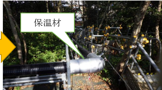
(写真1-2) 配管敷設状況 (今回 (10月8日) 撮影、5・6号機南側法面を南側から撮影)