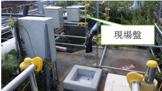
(写真2-1) サブドレンピット No. 72の現場盤設置状況 (今回 (10月8日) 撮影、5号機タービン建屋東側を北側から撮影)