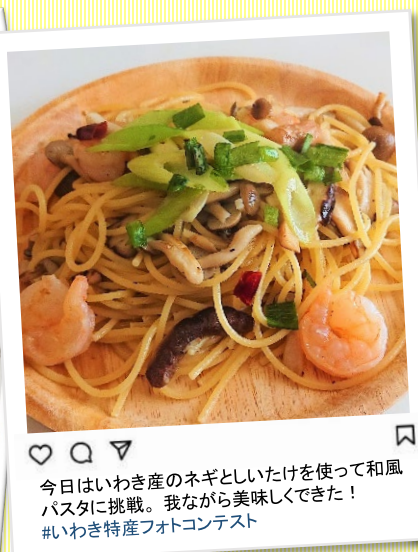
今日はいわき産のネギとしいたけを使って和風パスタに挑戦。我ながら美味しくできた! #いわき特産フォトコンテスト