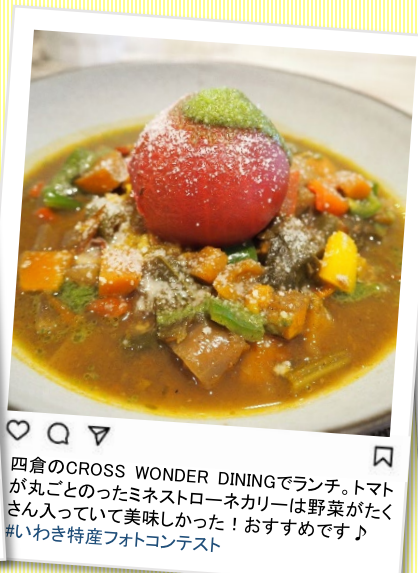
四倉のCROSS WONDER DININGでランチ。トマトが丸ごとのったミネストローネカリーは野菜がたくさん入っていて美味しかった! おすすめです♪ #いわき特産フォトコンテスト