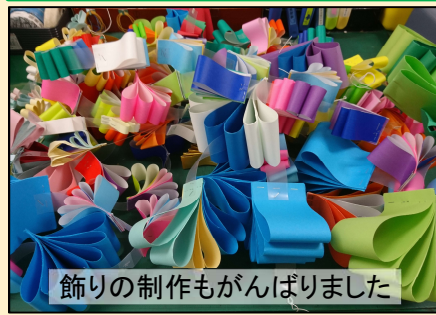
飾りの制作もがんばりました

◆今回は、11月3日（文化の日）に開催された「ミニ喜多方レトロ横丁」に七夕飾り等で参加。新型コロナの影響を感じさせない大盛況の中で、久しぶりに地域の方々との親交を深めることができました。