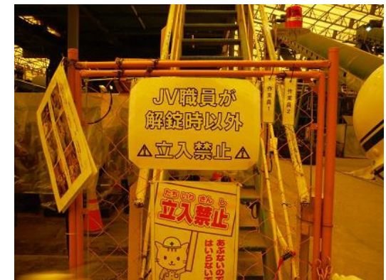
ガードフェンスの立入禁止措置