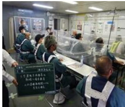
安全教育・意見交換会の様子