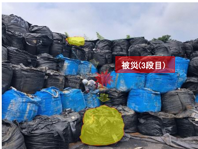
事故の発生状況（イメージ・黄色が大型土のう落下状況）