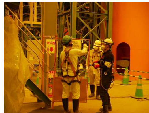
2人1組での作業へ変更