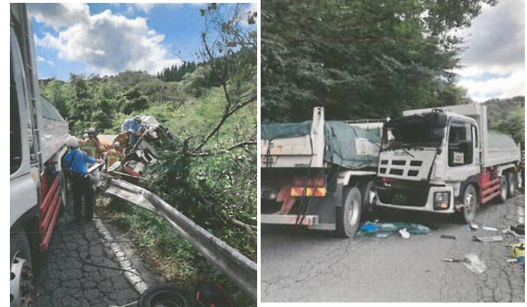
事故現場状況写真