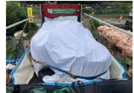
防水養生シートの固縛