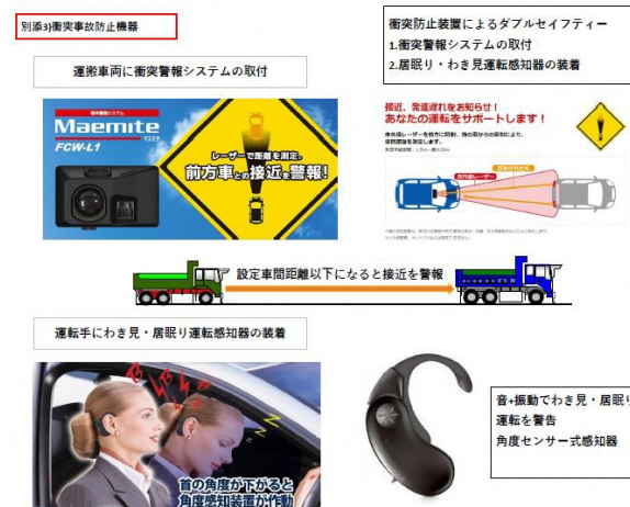
角度センサー式感知器及び衝突警報システム