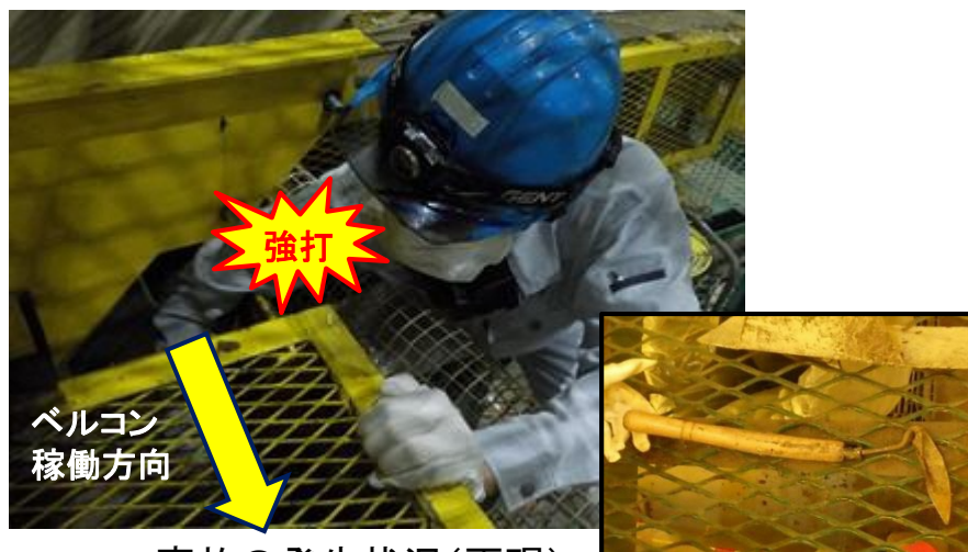
事故の発生状況(再現)