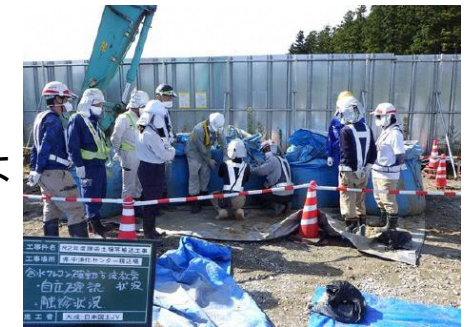
含水フレコン確認教育