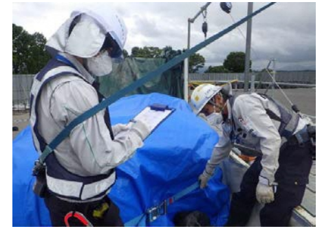
ダブルチェックをルール化