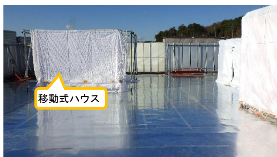
(写真2) 細断エリアの状況 (東側から撮影)