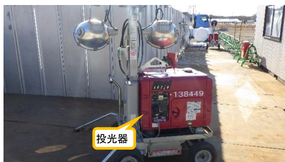
(写真3-1) エリア周囲に設置された投光器の一例 (北西側から撮影)