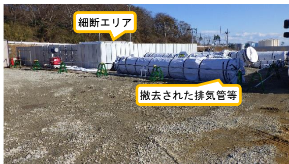
(写真1) 細断エリアの状況 (南西側から撮影)