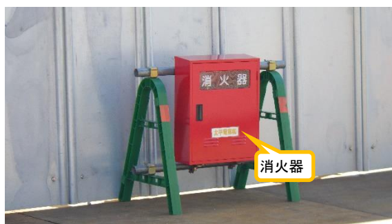
(写真3-2) エリア周囲に設置された消火器の一例 (西側から撮影)