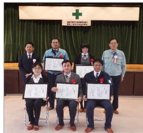
受賞者の皆様、 おめでとうございます