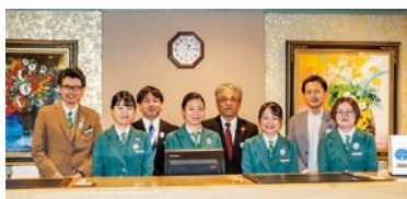
ホテルリステル猪苗代 スタッフ一同

ホテルリステル猪苗代は、磐梯山と猪苗代湖を一望できるリゾートホテルです。私たちのホテルでは、お客さまに「食の安全・安心」を実感していただけるよう、地元の食材をふんだんに使用したメニューを開発し、レストランで提供しています。また、お客さまに地域の魅力を伝え、新たな発見をしていただくことで福島のファンを増やし、地域全体をもっと盛り上げていきたいと考えています。今後も「食の安全・安心」と「地域の魅力」を伝えていけるよう、ひとつ、ひとつ、丁寧な発信を続けていきます。