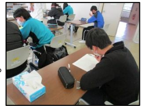
【演習問題に取り組む生徒】

将来教師を目指す大学生が学習サポーターとして3人一組で学習指導を行います。きめ細かな指導を行うために、1人が授業進行し、2人が個別対応を担います。生徒の疑問に答えたり、問題解決のヒントを与えたりすることで、効率良く学習が進むようサポートしています。