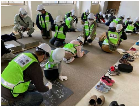
カーペットへのメッセージ記入