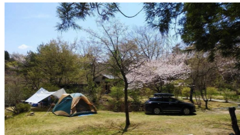
早渡ふじ公園より車で6分

カワセミや野うさぎ、りすなど動物に出会えたり、鉄分を多く含んだ温泉もあり、自然を楽しみながら入浴可能