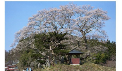
早渡ふじ公園より車で3分