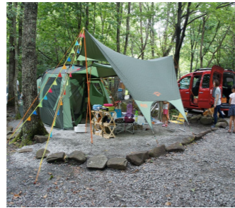
早渡ふじ公園より車で6分

標高550mにあるオートキャンプ場。ピザ焼き体験やキャンプファイヤーなどイベントも盛りだくさん。