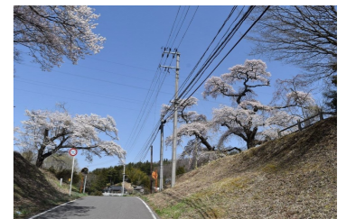
早渡ふじ公園より車で6分

小野町内には各所に桜スポットがあり、そのほとんどが樹齢400年以上。夜にはライトアップもあるので一日かけて桜巡りを楽しむことができます。