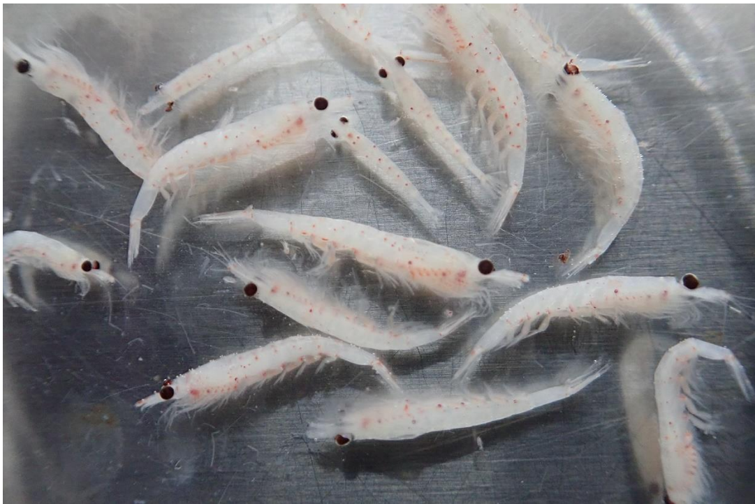
図2 丸稚ネットで採捕されたオキアミ

福島県水産海洋研究センターホームページにてカラーの画像を掲載しています https://www.pref.fukushima.lg.jp/sec/37380b/kounago.html